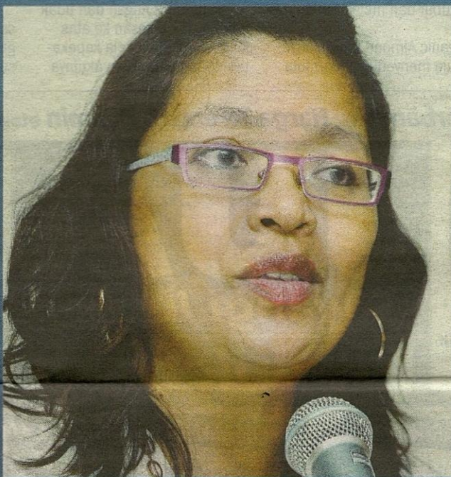
IVY... masalah keganasan berlaku pada semua kaum.

"Siapa mangsa paling mudah? Sudah tentu isteri. Kebanyakan daripada perlakuan terbabit dilakukan dalam keadaan sedar ataupun secara tidak sedar tanpa sebarang pertimbangan rasional daripada si pelakunya," katanya.